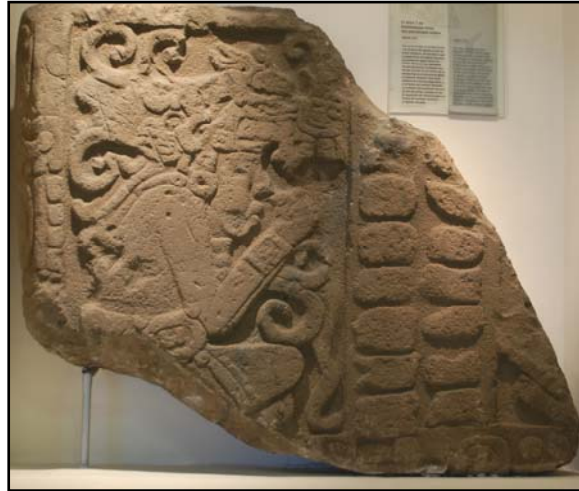
Figura 3. Fragmento de estela de Kaminaljuyú curada en el Museo Miraflores que ya ha sido documentada por medio de un escáner para el proyecto de imágenes de FAMSI de Doering y Collins.

fin de discutir la inclusión de piezas provenientes del sitio de Kaminaljuyú, de sus colecciones, en la base de datos del proyecto.