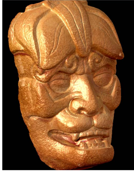
Figura 4. Toma en pantalla de la imagen escaneada con láser de una figura de máscara grotesca del sitio de Kaminaljuyú, curada en el Museo del Popol Vuh.