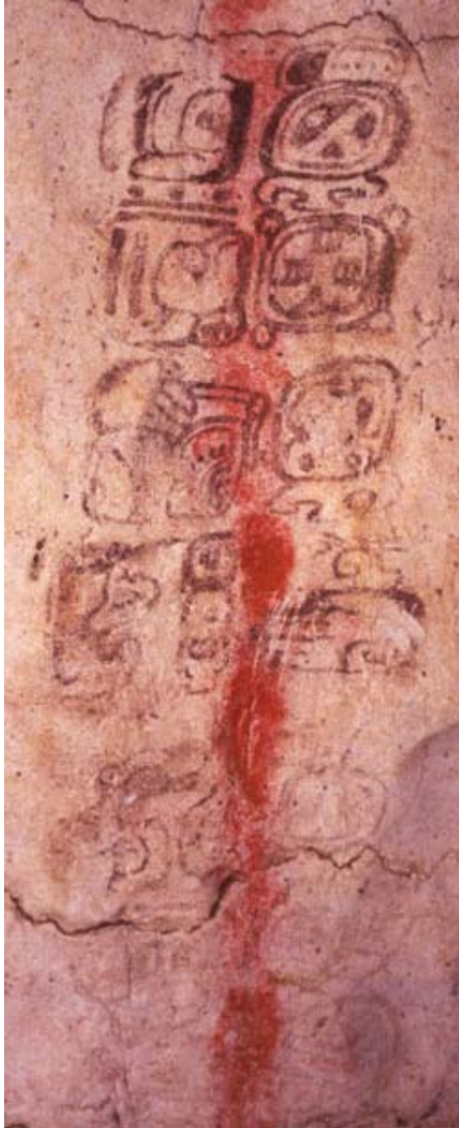
Figura 15. Pintura del Grupo 5.