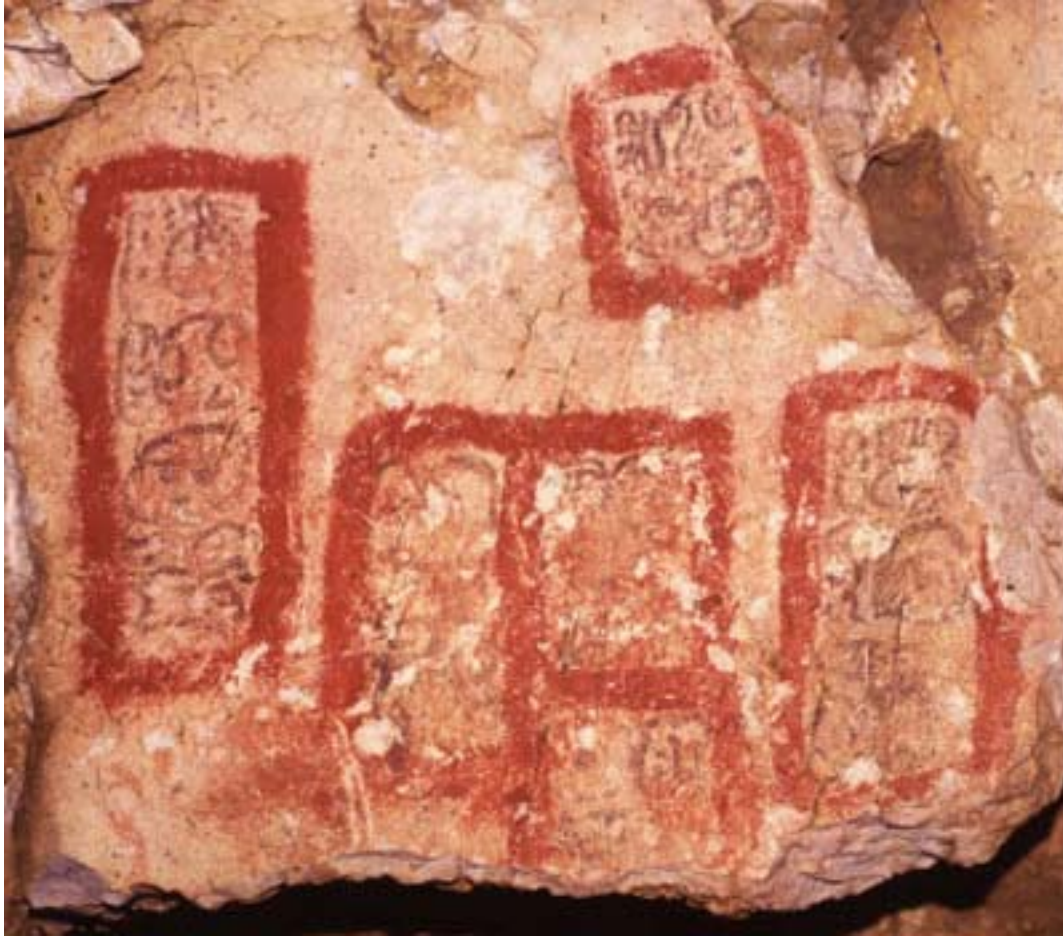
Figura 13. Pinturas 1-6 del Grupo 4.

La Pintura 2 del Grupo 4 consiste de cuatro glifos e incluye la palabra kele'em , "joven". Las Pinturas 3, 4 y 5 están compuestas de dos glifos cada una, pero sólo los contornos de estos glifos son visibles ahora. Los tres glifos en la Pintura 6 son más claros que los otros, y este texto empieza con un signo compuesto que se lee u ts'ihb "su escritura" (Stone 1995:90). Las frases u ts'ihb se usan en otros contextos para introducir el nombre de un escribano (Stuart 1987), y la Pintura 6 puede ser el ejemplo más temprano conocido de este tipo de frase.