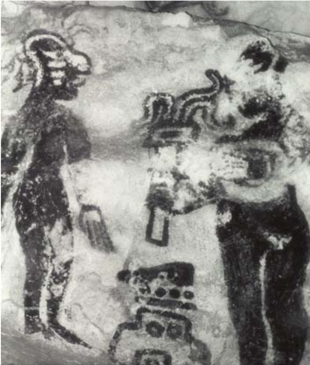
Figura 10. Fotografía infrarroja de las figuras en la Pintura 2 del Grupo 2.

arriba). La figura derecha sostiene un objeto en forma de dona en su mano izquierda y una antorcha en la derecha. La figura izquierda está parada con las manos a los lados. Lleva un tocado de plumas y su cara está decorada con pintura blanca en la nariz, bajo el ojo y en la coronilla de la cabeza ( Figura 10 , abajo).