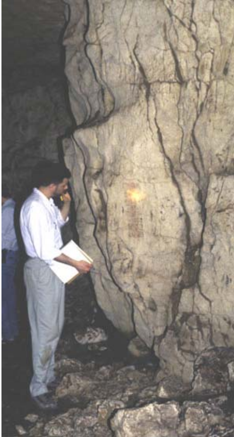
Figura 16. Pintura del Grupo 6 con Marc Zender.