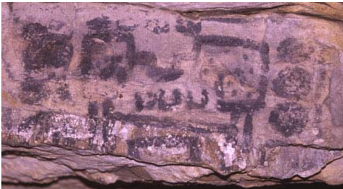
Figura 11. Pintura 3 del Grupo 2.

creando un espacio cuadrilateral en su superficie. La salida y la puesta del sol del solsticio definieron las esquinas del mundo cuadrilateral, y las cuatro grandes montañas direccionales demarcaron sus lados. Los humanos podían vivir con seguridad dentro del mundo cuadrilateral, si hacían las ofrendas apropiadas a los dioses.