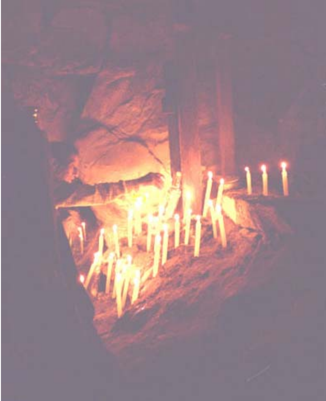
Figura 5. Ceremonia del Día de la Cruz en la Cámara 1.

La segunda cámara está situada aproximadamente 125 m adentro del pasaje principal de la cueva, partiendo de la boca de la cueva. Se entra a la Cámara 2 desde el lado oeste del pasaje. La cámara mide aproximadamente 8x4 m. Su piso está libre de escombros, excepto por pequeñas rocas que se encuentran en el extremo final, muy restringido.