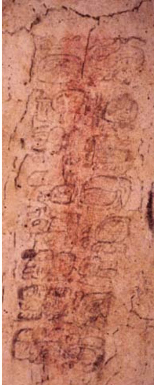
Figura 17. Pintura del Grupo 6.