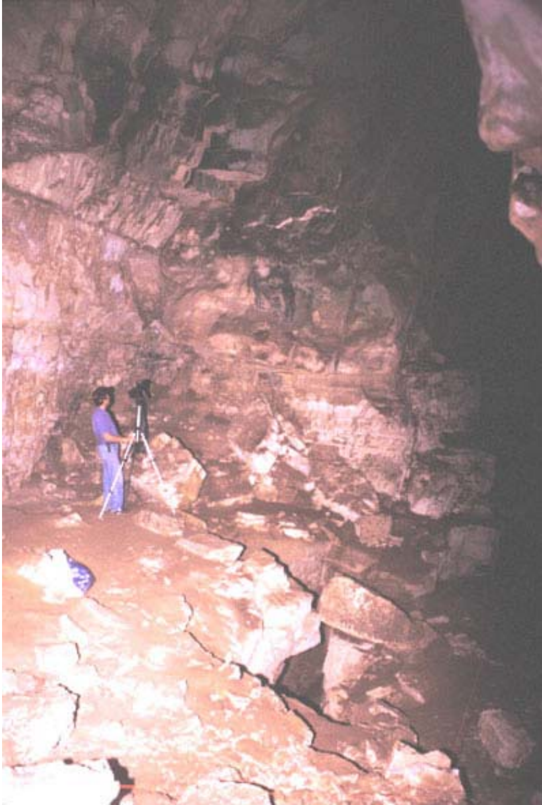
Figura 4. Las pinturas del Grupo 2 y la entrada a la Cámara 1. Jorge Pérez de Lara, miembro del proyecto.