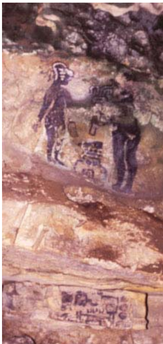
Figura 7. Pinturas del Grupo 2.

El Grupo 2 está compuesto por tres pinturas (Pintura 1, Pintura 2 y Pintura 3) ( Figura 7 ). Estas imágenes están pintadas una sobre la otra pero en la superficie de rocas separadas. El acceso físico a las Pinturas 1 y 2 es difícil por su localización en lo alto de la pared, sobre una saliente de roca. Su localización inaccesible parece haberlas protegido parcialmente del vandalismo. La pintura inferior (Pintura 3) está debajo de la saliente rocosa, y no ha sido tan afortunada. Una comparación de su condición actual con las fotografías de Blom revela que la esquina inferior derecha ha sido cincelada. El daño ocurrió antes de 1986, ya que la esquina también falta en la fotografía de 1986, publicada por Alejos (1994:95).