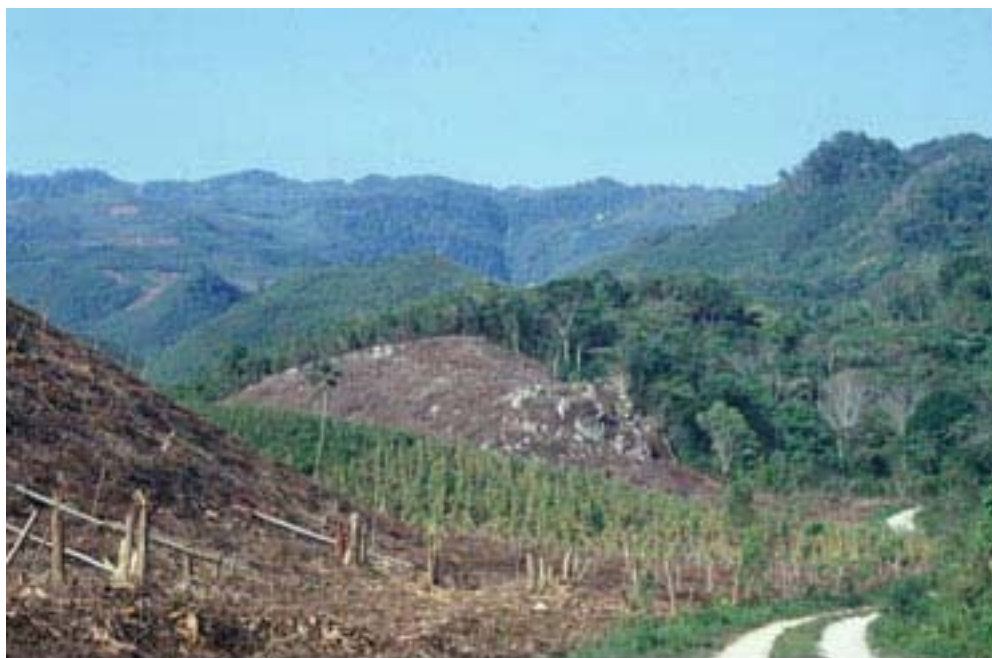
Figura 1. La raya oscura en el borde de la montaña Misopa' es la garganta del río Ixtelja. Jolja' se localiza en lo alto de la garganta.

El sitio de Jolja' está situado en la montaña de Misopa', en una garganta fluvial en la cabecera del río Ixtelja (N 17 20.916' W92 19.509') ( Figura 1 ). El sitio está a una altura de 900 m en esta montaña de 1,650 m de elevación. Las tres cuevas están en la propiedad de la comunidad de Joloniel, que es un ejido dentro del distrito de Tumbalá. El centro de la comunidad de Joloniel está situado 1.45 km bajo las cuevas, a una elevación de 600 m.