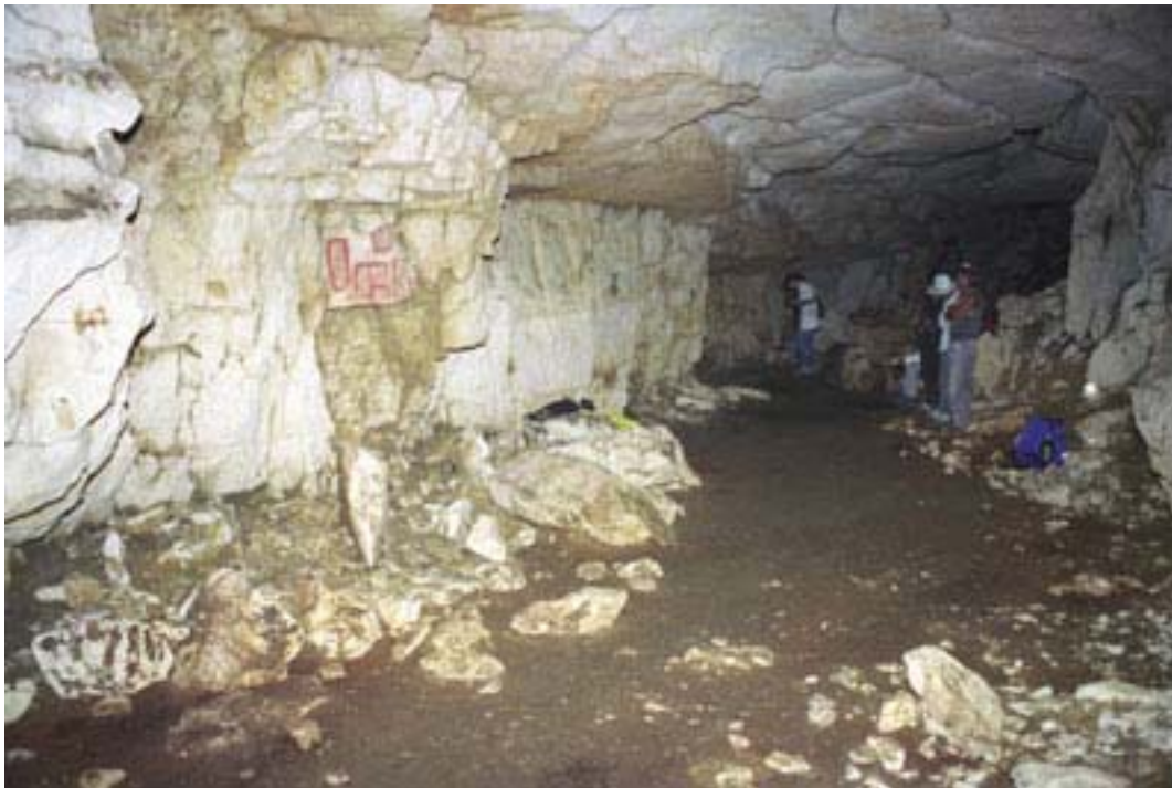
Figura 12. Pinturas del Grupo 4.

El Grupo 4 está compuesto por siete pinturas situadas justo al sur del Grupo 3 ( Figura 12 ). Seis inscripciones cortas delineadas con pintura roja gruesa están situadas en la pared oeste de la cueva (Pinturas 1-6). Frente a estos textos hay una laja de piedra que yace sobre el piso de la cueva. Es evidente de las marcas de fracturas en la pared que ésta fue cincelada del área inmediatamente debajo de las pinturas en el muro. Las fotografías de Blom muestran que la piedra estaba pintada con 32 glifos en cuatro columnas (Pintura 7). Como los textos superiores, una línea roja gruesa encerraba los glifos. Las fotos de Blom indican que el saqueo ocurrió antes de su visita, debido a que ella tiene varias vistas de la Pintura 7, en las que ya está en el piso. El gran tamaño y peso de la piedra probablemente impidieron su remoción de la cueva.