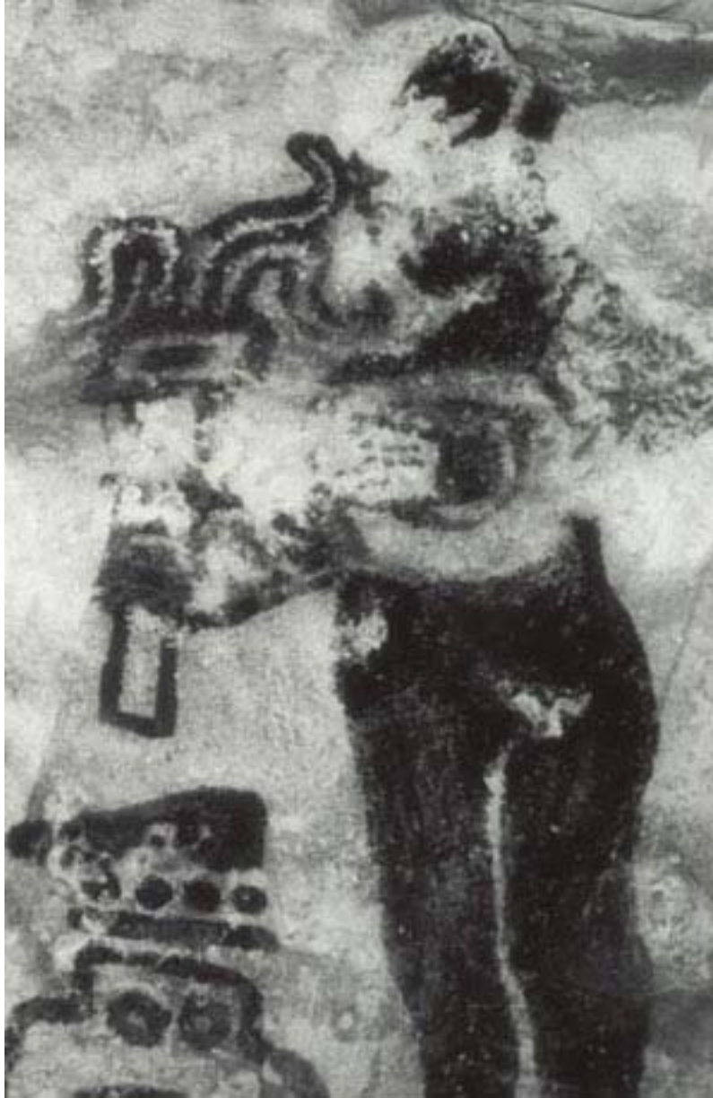
Figura 9. Fotografía infrarroja de la figura derecha de la Pintura 2, Grupo 2.